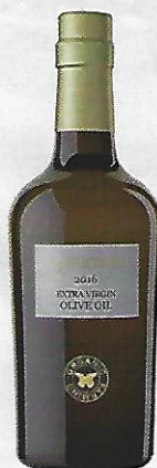
EXTRA-VIERGE Huile d'olive, Gratavinum, verger écologique espagnol, Les Vins d'Hélène, 30 € les 50 cl.