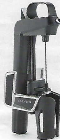
VIN MALIN Avec le Two Elite, pas besoin d'ouvrir la bouteille pour se servir, Coravin, 349 €.