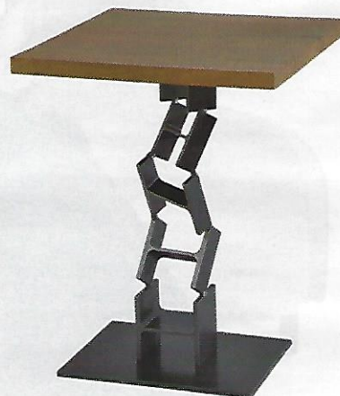
BISTROT BOBO Table design composée d'IPN, plateau en chêne, Ipnoze, 750 €.