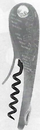
MERLOT, CABERNET Tire-bouchon Soft Machine Vignobles du monde, édition Bordeaux, L'Atelier du Vin, 65 €.