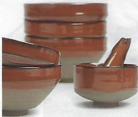
POWER BOWLS Service en grès émaillé, Meal x 3, Merci pour Serax, bol à partir de 12 €, cullière à partir de 8,50 €.