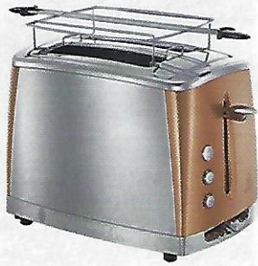
TRANCHE D'HISTOIRE Grille-pain Luna, design vintage, inox et acier coloré cuivre, Russell Hobbs, 59,90 €.