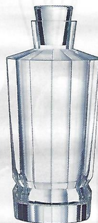
L'ART DU SERVICE Carafe Macassar style Art déco, Cristal d'Arques, 39,90 €.