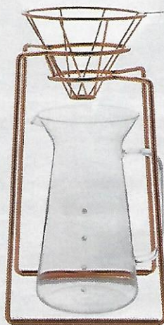
CAFÉ À L'ANCIENNE Kit de filtration lente, avec support cuivré et carafe, Toast, 94 €, chez Comptoirs Richard.